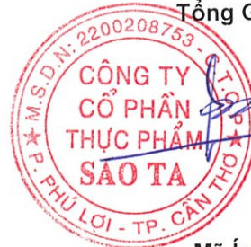
Mã Ích Hưng